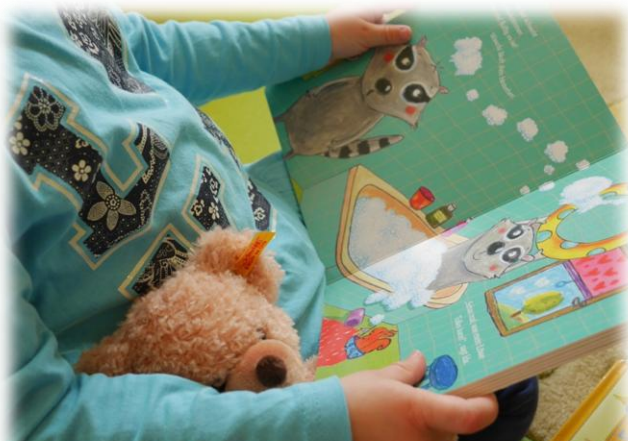
Abbildung: Sprach- und Medienkompetenz

Darunter verstehen wir den gemeinsamen Umgang mit verschiedenen Medien, vor allem die Vertrautheit mit Bilderbüchern mittels Bild- und Bilderbuchbetrachtungen. Daneben schaffen wir vielfältige Sprechansätze. Dazu zählen Reim- und Fingerspiele, gemeinsame Sprech- und Singspiele sowie Mitmachgeschichten, die durch Gesten begleitet werden.