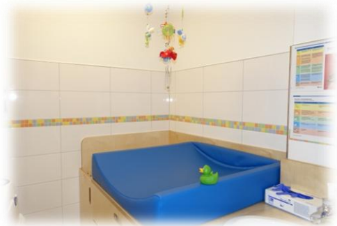
Abbildung: Wickelkommode

Die Kinder unserer Einrichtung werden in der Regel noch gewickelt. Jedes Kind hat ein eigenes Fach in der Wickelkommode, in welchem Windeln, Feuchttücher und Wechselwäsche aufbewahrt werden. Dem Alter entsprechend werden die Kinder in die Vorbereitungen des Wickelns miteinbezogen. Größere Kinder können über eine Treppe an der Seite der Wickelkommode selbst hochklettern. Wickelprozesse werden seitens des pädagogischen Personals sprachlich begleitet, wodurch eine geborgene, liebevolle Atmosphäre entsteht.