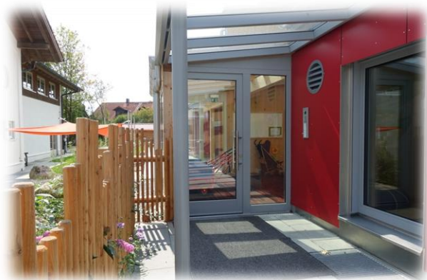
Abbildung: Eingangsbereich

Die pädagogische Kernzeit ist von 8:30 Uhr bis 14:00 Uhr festgelegt. In dieser Zeit müssen alle Kinder anwesend sein.