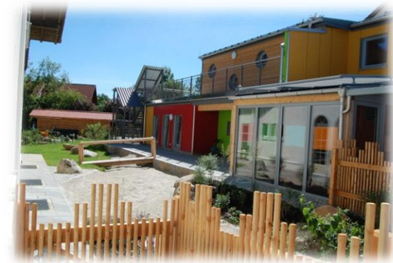
Abbildung: Außenanlage