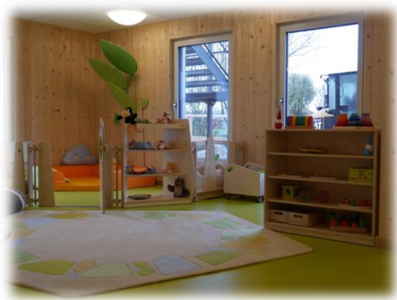
Abbildung: Gruppenraum