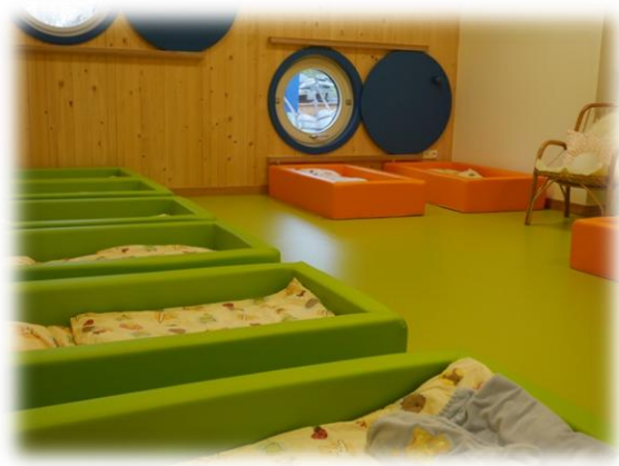
Abbildung: Schlafraum