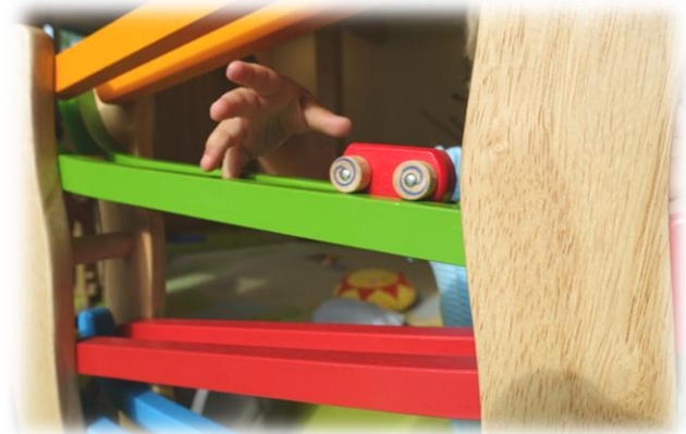
Abbildung: Qualitätsentwicklung und -sicherung

Hierbei spielt die Sicherung der Qualität unserer Arbeit eine bedeutende Rolle, die auch eine enge und vertrauensvolle Zusammenarbeit mit unserem Träger, dem Bayerischen Roten Kreuz Kreisverband Ebersberg beinhaltet.