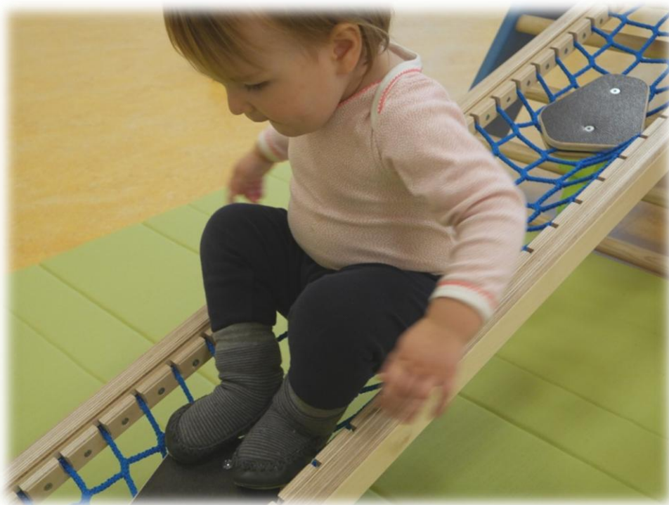
Abbildung: Bewegung (Eigene Aufnahme 2017)

Kinder haben stets Freude daran, sich zu bewegen und erlangen durch das Erproben neuer Bewegungsformen zunehmend mehr Sicherheit. Unsere Gruppenräume bieten Spielanregungen durch kleine Ebenen, Schaukeln und verschiedene Kleinmaterialien, wie zum Beispiel unterschiedliche Bälle. Der große Bewegungsraum im Untergeschoss ist mit vielen verschiedenen Materialien ausgestattet, die das Klettern, Rennen und vieles mehr ermöglichen. Außerdem wird die Bewegungsfreude beim Spielen im Garten oder bei Spaziergängen angeregt.