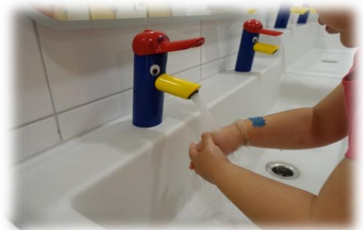
Abbildung: Körperpflege