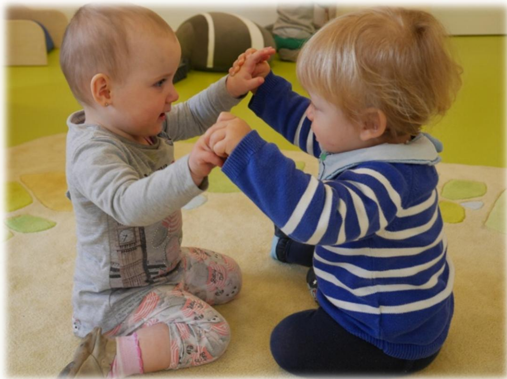
Abbildung: Eingewöhnung (Eigene Aufnahme 2017)

Der Zeitraum der Eingewöhnung dauert in der Regel vier bis sechs Wochen, kann aber bis zu acht Wochen in Anspruch nehmen. Auch hierbei ist die Mitarbeit der Eltern von großer Bedeutung. Unabhängig von unserem Einfluss auf das Kind, ist eine positive Haltung des mitarbeitenden Elternteils gegenüber der Einrichtung und dem Personal ebenfalls ein relevantes Kriterium für eine gelungene Eingewöhnung.