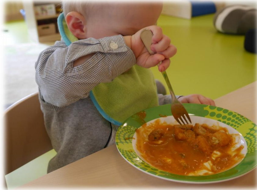
Abbildung: Ernährung

Das Mittagessen wird durch die Firma APETITO, in Form von Tiefkühlkost, geliefert. Unsere Küchenkraft ergänzt diese Speisen mit Beilagen, frischem Obst, Gemüse oder einer frisch zubereiteten Nachspeise.