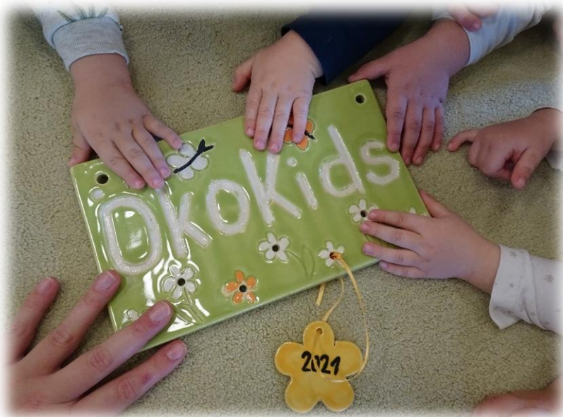
Abbildung: Umweltbewusste Kinder

Unser Ziel ist es, die Spiel- und Lebensräume auf nachhaltige, umweltfreundliche Weise zu gestalten und die Kinder, das Team, die Eltern und den Träger für das Thema Umweltschutz zu sensibilisieren. Für das Engagement der Kolleg/innen, Kinder, Eltern und Kooperationspartner/innen wurde die Kinderkrippe 2021 vom Landesbund für Vogelschutz in Bayern e.V. mit der Ökokidsplakette ausgezeichnet.