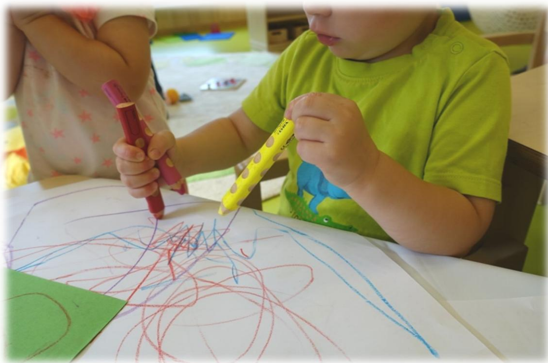
Abbildung: Künstlerisch aktive Kinder

In Bezug auf unsere pädagogische Praxis bedeutet dies, dass wir dem Kind die Möglichkeit bieten, die eigene Kreativität und Fantasie zum Ausdruck zu bringen. Dazu zählen Tätigkeiten wie Malen und Gestalten von Bildern, gemeinsam oder alleine, Kneten, Basteln, Reißen, Schmierern und auch das Experimentieren mit unterschiedlichen Materialien. Gemeinsames Singen, Musizieren und Tanzen nimmt bei uns ebenfalls einen hohen Stellenwert ein. Kinder können hierbei unterschiedliche Ausdrucksformen erproben und einen Eindruck von Rhythmus erfahren.