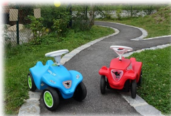
Abbildung: Bobbycarstrecke