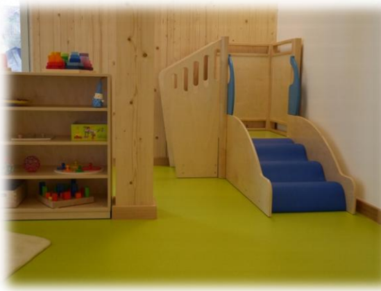
Abbildung: kleine Ebene - Gruppenraum