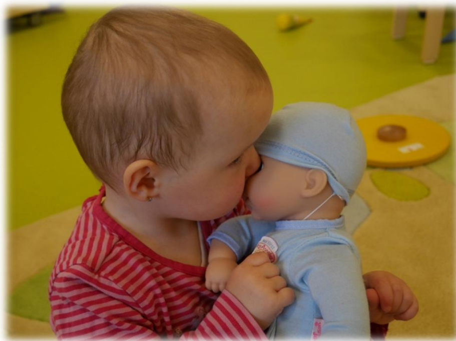
Abbildung: Unser Bild vom Kind (Eigene Aufnahme 2017)

Jedes Kind wächst in seinem Tun und verinnerlicht durch das aktiv sein unterschiedliche Handlungsabläufe. Vor allem in der Gruppe lernen Kinder Neues sehr schnell. Wir akzeptieren jedes Kind auf seine Weise und geben ihm die nötige Hilfestellung, um in seiner Entwicklung voranzukommen.