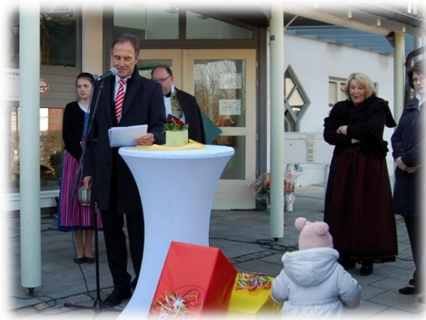
Abbildung: Eröffnungsfeier - 11. März 2017

Am 24. Februar 2017 bekam die BRK Kinderkrippe ihre Betriebserlaubnis durch das Landratsamt Ebersberg und konnte zum 1. März 2017 eröffnet werden.