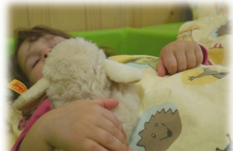
Abbildung: Schlafen

Die Schlaf- und Ruhezeit beginnt für alle Kinder nach dem Mittagessen. Jedes Kind hat sein eigenes „Nestchen“, das mit Decke und Kissen, sowie Bezügen ausgestattet ist. Schnuller und Schmusetiere können bei Bedarf von zu Hause mitgebracht werden. Die Kinder machen sich zum Ausruhen fertig und schlafen in Body oder Unterwäsche. Das pädagogische Personal begleitet die Kinder während dem Einschlafen und verweilt die gesamte Ruhezeit über im Schlafräum.