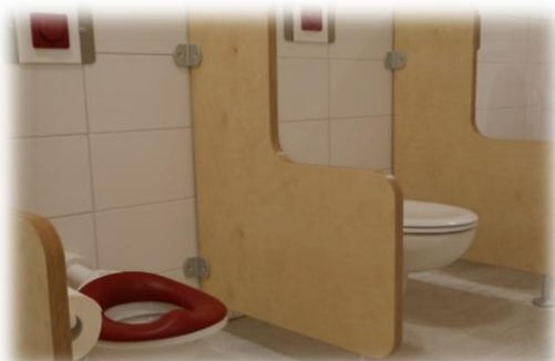
Abbildung: Sauberkeitserziehung

Jedes Kind möchte früher oder später „windelfrei“ werden. Der Zeitpunkt dafür sollte ausschließlich vom Kind selbst bestimmt werden. Ab dem zweiten Lebensjahr sind Kinder in der Lage den Schließmuskel bewusst zu kontrollieren. Sie müssen lernen die Signale des Körpers richtig zuzuordnen. Das pädagogische Personal beobachtet das Kind und unterstützt es bei jedem neuen Entwicklungsschritt. Auf dem Weg zur Sauberkeitserziehung ist neben einem intensiven Austausch auch eine gute Zusammenarbeit zwischen Eltern und Krippenpersonal für einen positiven Prozess entscheidend, sowie Lob als Bestärkung und Geduld. Ansprechende, kleinkindgerechte Toiletten regen zum Ausprobieren an. Praktische Kleidung wie Hosen mit Gummizug und Unterhosen sind hierbei hilfreich.