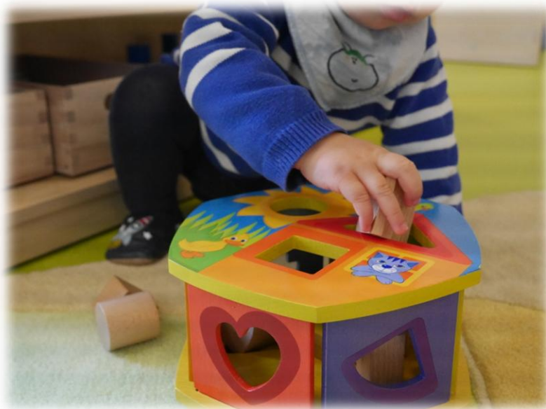
Abbildung: Reggio-Pädagogik