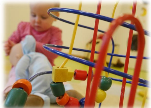
Abbildung: Vernetzung

Die Vielfalt und Notwendigkeit der Kontakte und Vernetzungspartner ist für unsere Kinderkrippe wichtig, um den Kindern und Familien verschiedene Fördermöglichkeiten und Kooperationspartner anbieten zu können.