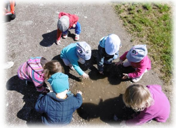
Abbildungen: Spaziergänge im Frühling