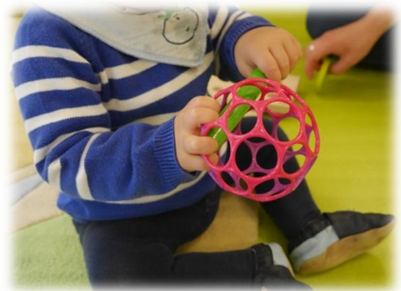
Abbildung: Beteiligungsmanagement

Zunächst fällt es schwer, sich vorzustellen, wie sich zum Teil noch nicht sprachfähige Kinder verständigen sollen.