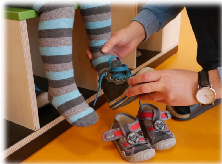
Abbildung: Anziehsituation