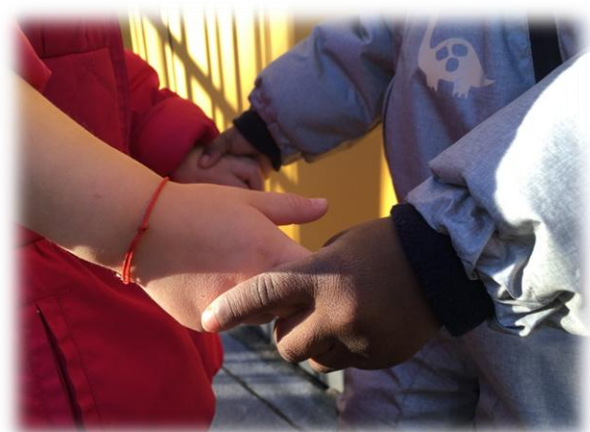
Abbildung: Kinderhände

Jedem Kind soll Raum und Zeit für faire, gleiche und gemeinsame Lern- und Entwicklungschancen geboten werden. Dies erreichen wir, indem wir auf Unterschiede und Besonderheiten der Kinder eingehen und ein differenziertes Bildungsangebot sowie eine individuelle Lernbegleitung, auch bei gemeinsamen Lernaktivitäten, anbieten.