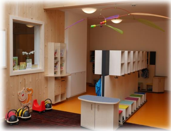
Abbildung: Garderobenbereich – EG