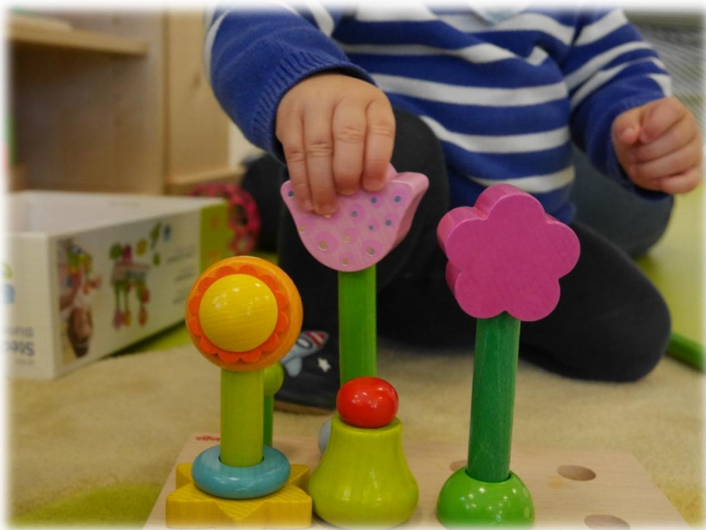
Abbildung: Fragende und forschende Kinder (Eigene Aufnahme 2017)

Die Kinder sammeln ständig Erfahrungen in diesen Bereichen. Zum Beispiel kommen sie im Kleinkindalter durch Bauklötze bereits in Berührung mit verschiedenen Farben und Formen. Außerdem werden beim Spiel mit dem Element Wasser und durch den Einsatz von unterschiedlichen Materialien Eindrücke gewonnen. Bei Spaziergängen oder im Garten können ebenso die unterschiedlichsten Naturbeobachtungen gemacht werden.