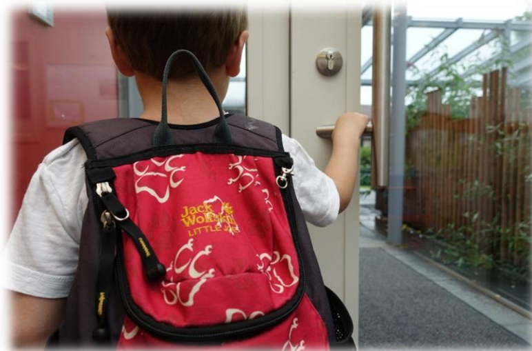
Abbildung: Vom Krippen- zum Kindergartenkind

Außerdem wird dieser Prozess durch eine intensive Kooperation mit dem BRK-Kinderhaus Oberpfraammern unterstützt. Es finden schon im Vorfeld Schnuppertage in den jeweiligen Gruppen statt, an denen die Kinder sowohl die Bezugspersonen der Kindergartengruppen als auch die Räumlichkeiten kennen lernen.